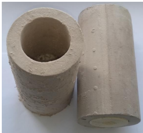
Рисунок 4 - Теплоизоляционная вставка.