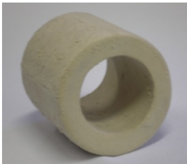
Рисунок 2 - Теплоизоляционная вставка

11.3 При транспортировании должна быть обеспечена защита транспортной тары с упакованной установкой от прямого попадания влаги (атмосферных осадков и пыли). При транспортировании – не кантовать.