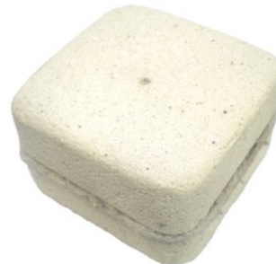
Рисунок 3 - Теплоизоляционная крышка

Отдел продаж ООО «Индукционные установки»